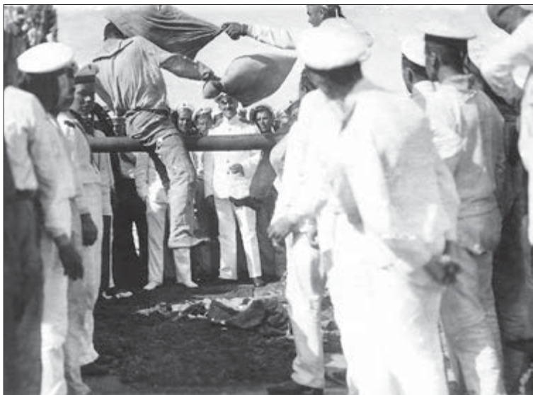
День судового праздника на линейном корабле «Императрица Мария» в море. Игры для команды. 22 июля 1916 г.: ГАРФ. Ф. 685. Оп. 1, Д. 228. Л. 2.