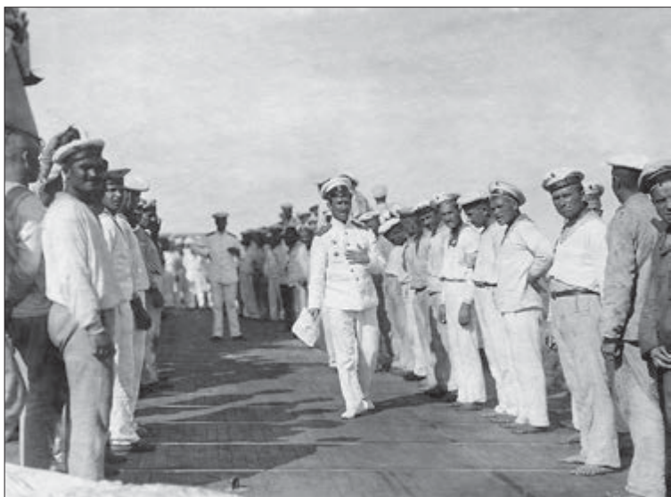
В море в день судового праздника линейного корабля «Императрица Мария». 22 июля 1916 г.