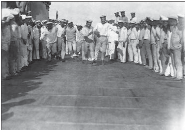
В море в день судового праздника линейного корабля «Императрица Мария». Состязание в беге для команды. 22 июля 1916 г.: ГАРФ. Ф. 685. Оп. 1. Д. 228. Л. 4.