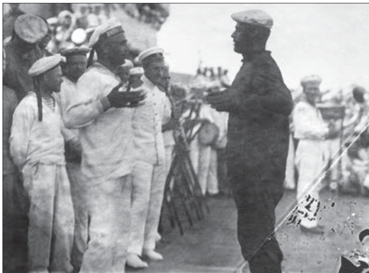
В море в день судового праздника линейного корабля «Императрица Мария». Конкурс танцоров. Кочегар явился прямо с вахты. 22 июля 1916 г.: ГАРФ. Ф. 685. Оп. 1. Д. 228. Л. 3.